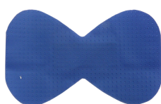
Sanoblue doigt 75x46 mm