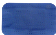
Sanoblue jumbo 60x38mm